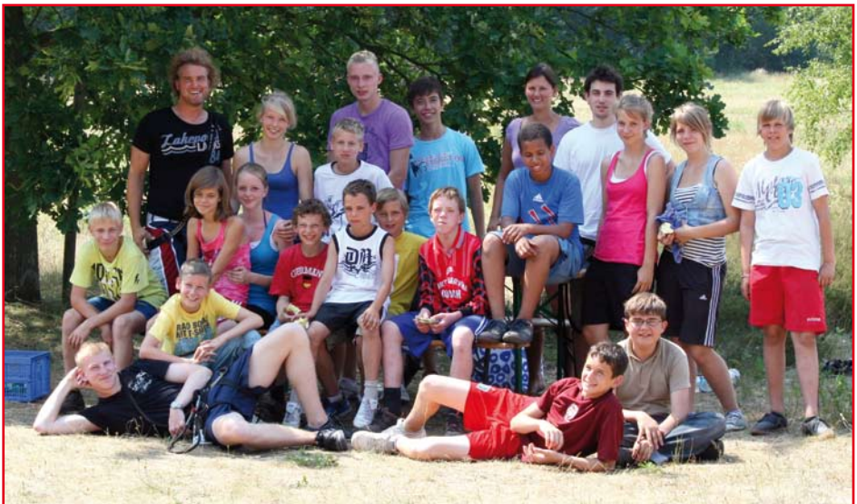
Die ganze Zeltlagergruppe nach dem Klettergarten