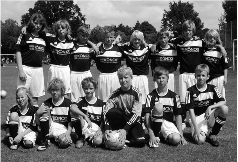
1. D SVCN mit neuen Auswärtstrikots der Fa. Köncke-Bauausführungen

Erschöpft und müde, bedingt auch durch die herrschende Hitze, freute sich am Ende des Turniers der Vorjahressieger SC Poppenbüttel über den erneuten Turniersieg. Wie auch am Vormittag wurden die Mannschaften mit einem Pokal und jeder Spieler mit einer Medaille geehrt.