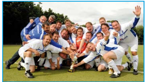
Siegerfoto mit Pokal