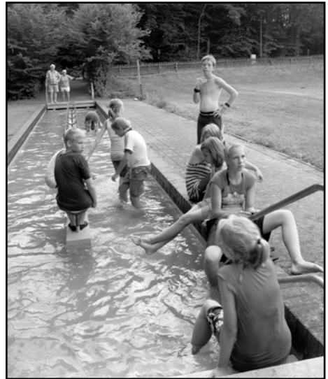
Abkühlung mit allen am Kneipp-Bad des Zeltplatzes

Auch in den folgenden Tagen war das Waldbad unser zweites zu Hause. Immer wieder ging es dort zur Abkühlung hin. Nach der ersten Nacht die in der Regel immer recht kurz ausfällt, weil alle Kinder noch über ausreichend Energie verfügen und somit nicht viel Schlaf brauchen geht es nach dem Frühstück immer ans Zelte aufräumen. Und auch wenn es die Eltern immer gar nicht glauben können, die Kinder sind höchst motiviert bei der Zeltbenotung die volle