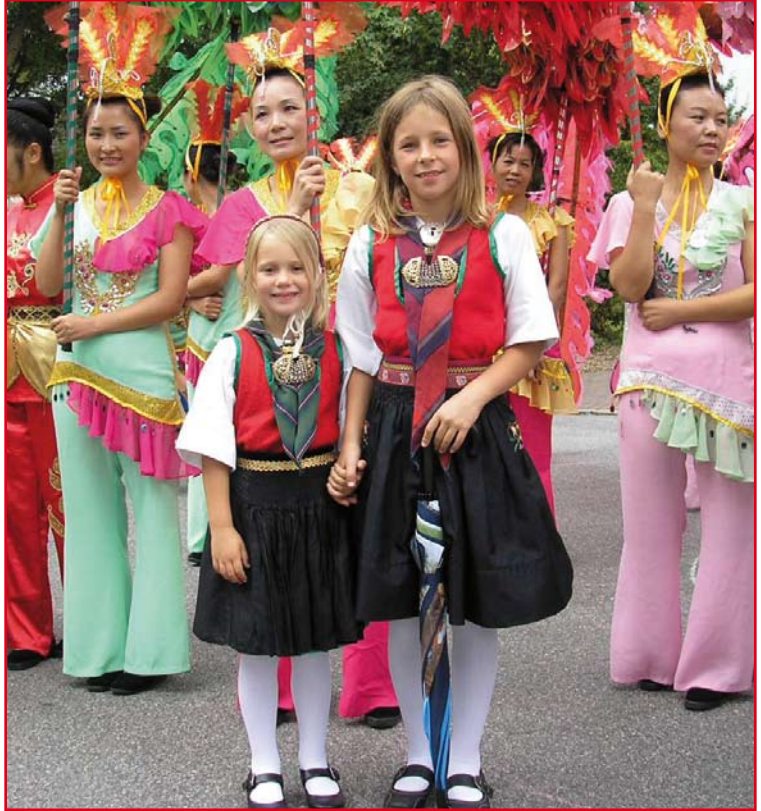
Die Trachtengruppe des SCVM beim Folklore- und Trachtenumzug in Neustadt (S. 7)