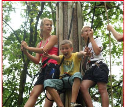
Spass hoch oben in den Bäumen