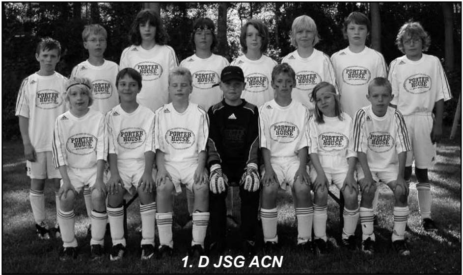
1. D JSG ACN